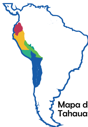
Mapa del Tahuantinsuyo

Luego de dividir el imperio del Tahuantinsuyo, los invasores crearon las primeras fuerzas llamadas ESCOPETEROS, su función fue dar seguridad a los españoles, sometiendo a los indígenas a su religión y dar estabilidad al gobierno español; también perseguían y capturaban a los runakunas, indígenas que no estaban de acuerdo con los invasores.