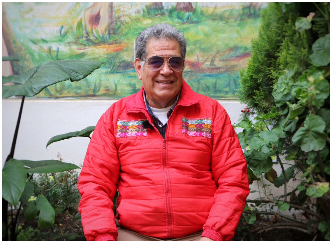
Foto: Andrés Alencastre, economista y exministro de Desarrollo Agrario y Riego.

Reconocer a las comunidades como actores con capacidad de autogobierno y entender al país desde sus cuencas permitiría avanzar hacia una gobernanza del agua más justa y sostenible.