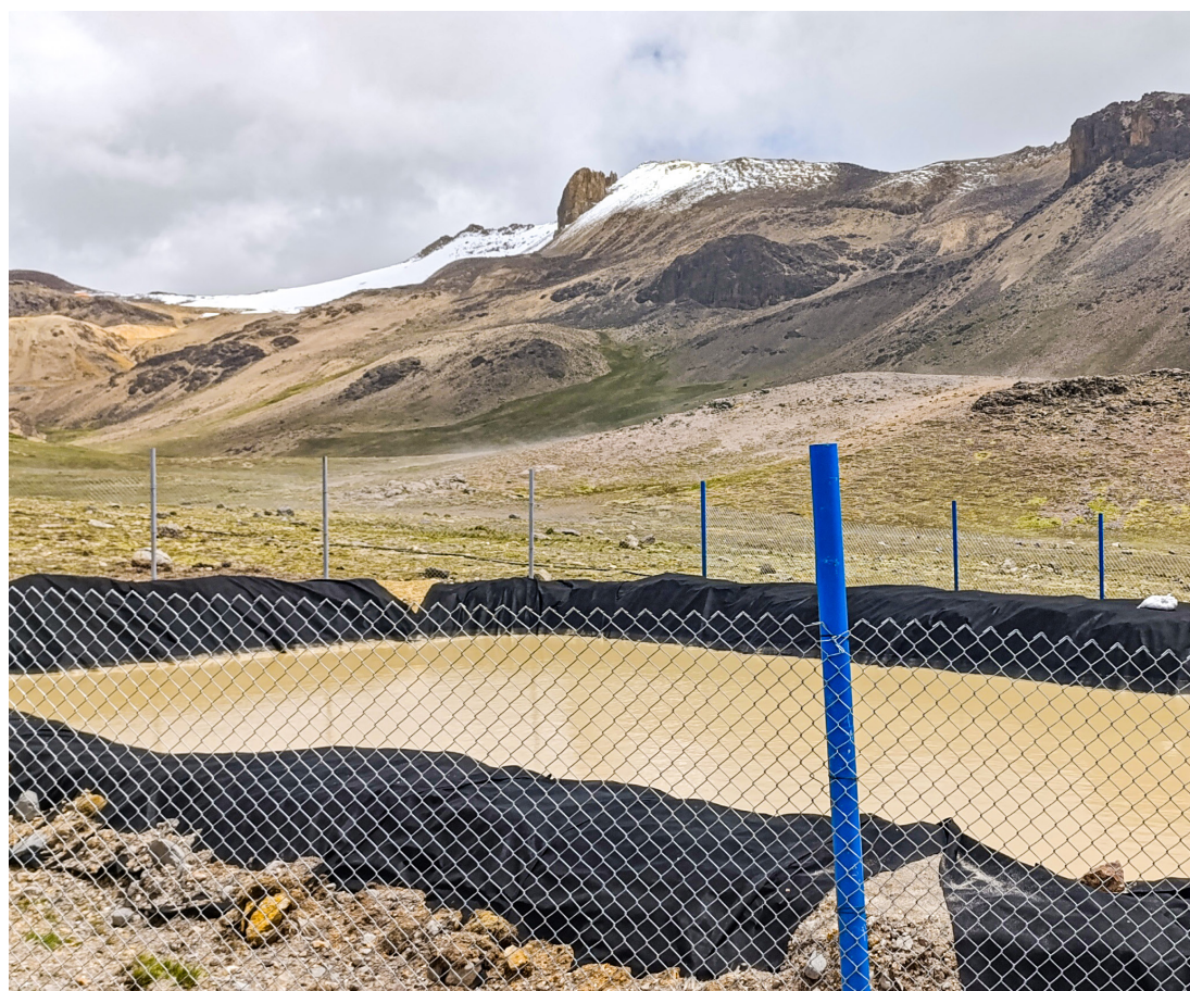
Foto: Zona cercana a Apu Curasma, pozo temporal de la minera Crespo en Chumbivilcas.

Al cierre de esta edición, la población de Chumbivilcas ratifica su decisión de continuar con las medidas de fuerza. Este conflicto pone en evidencia la deuda del Estado con las comunidades campesinas del sur andino: la protección de las cabeceras de cuenca y el cumplimiento del derecho a la consulta previa no son negociables. El agua que nace en el Nevado Curasma no abastece a una empresa. Abastece a miles de familias.