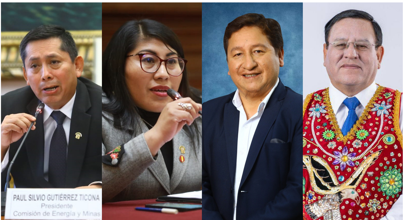
Foto: Congresistas de Cusco y Apurímac

Un análisis de las declaraciones juradas ante la Contraloría revela incrementos patrimoniales de hasta el 570%, mientras los parlamentarios de Cusco y Apurímac aseguran su reelección.