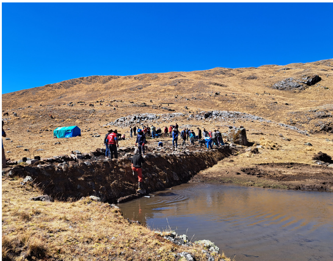
Foto: Siembra y cosecha de agua en Paruro